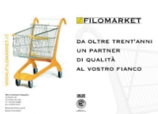
Immagine e contenuti

L a campagna pubblicitaria realizzata per questo 2002 in Italia, indirizzata ad alcune delle maggiori testate giornalistiche del settore, è la più consistente mai realizzata da Filomarket ed è nata dalla certezza che un'attenta comunicazione amplifichi non solo l'immagine dell'Azienda ma anche i concetti e le politiche che ne decretano le azioni. Dal 1994 Filomarket è presente con sei inserti a piena pagina sulla rivista "Largo Consumo" e, da quest'anno, altrettanti inserti (a mezza pagina) compariranno anche sulle riviste Mark-Up e Lay-out. L'impostazione grafica della pagina, al di là della dimensione, mantiene il medesimo messaggio che riporta inequivocabilmente a concetti di customer satisfaction, da sempre fonte di ispirazione e motore di tutte le azioni commerciali dell'Azienda: "Filomarket, da oltre 30 anni un partner di qualità al vostro fianco".